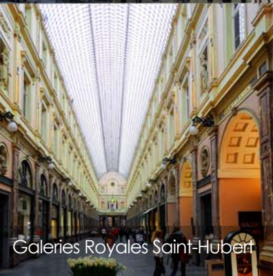
Galeries Royales Saint-Hubert