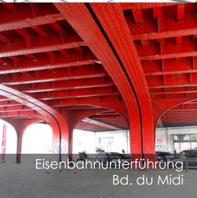
Eisenbahnunterführung Bd. du Midi