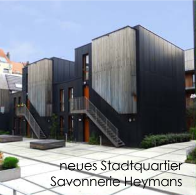
neues Stadtquartier Savonnerie Heymans